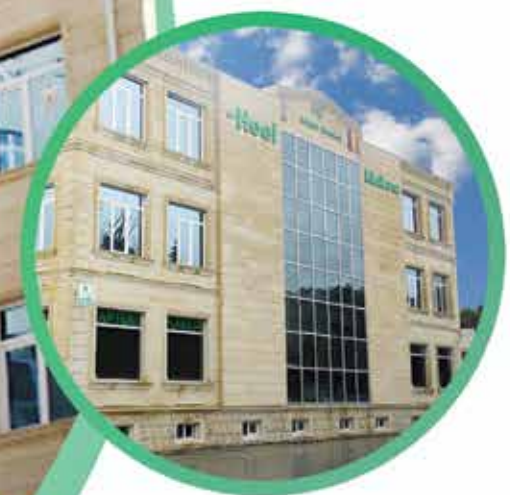
Göyçay Bioloji Təbabət Klinikası