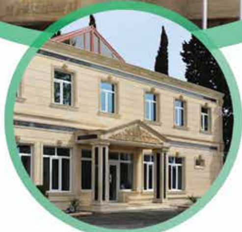
Sumqayıt Bioloji Təbabət Klinikası