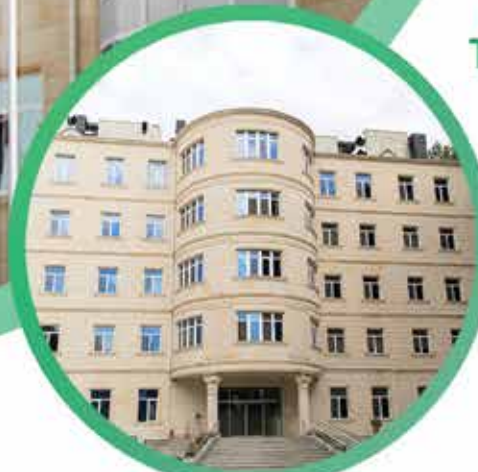
Masallı Bioloji Təbabət Klinikası