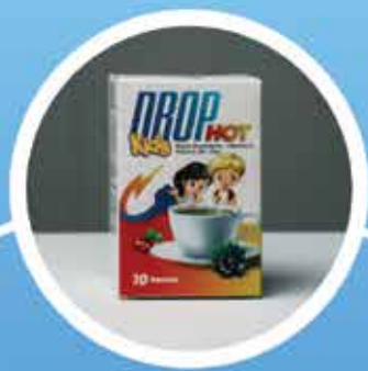
DROP HOT Kids