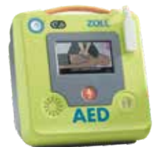
ZOLL AED 3®